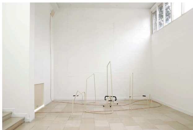
Polder , 2007

En invitant Tatiana Trouvé à participer à LA NOTTE, Lorenzo Benedetti introduit des œuvres qui viennent troubler les dimensions, les perspectives et les échelles d'un lieu. Il prend le parti de troubler les perceptions du spectateur.