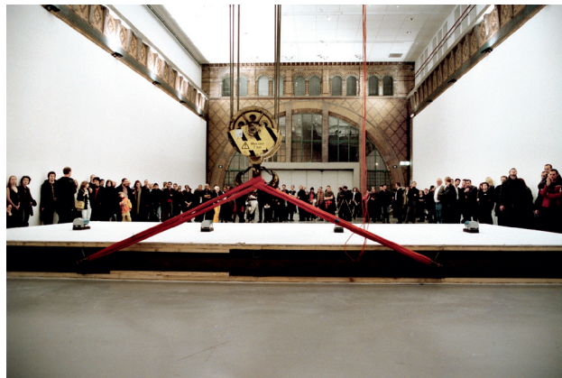
StarkActOfRemoval , Rooseum, Malmö, Sweden, 2001