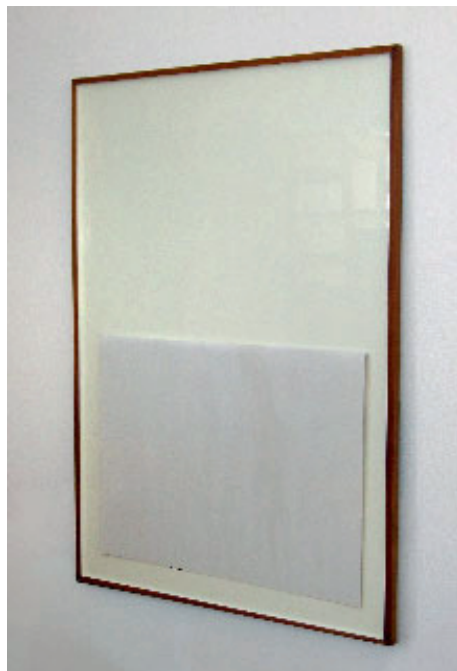
The Archives (Pour la solidarité anti-impérialiste, pour la paix et l'amitié), 2008