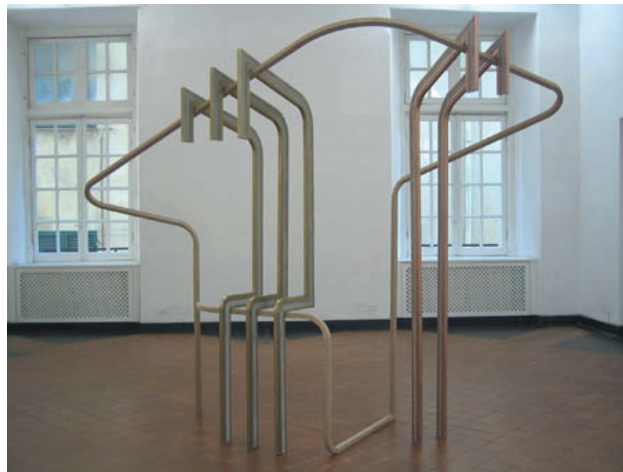
Everything makes sense in the reverse , 2005

Dans ses sculptures, ses collages ou ses films, Bojan Sarcevic explore la modernité puis son abandon à travers l'ornement et la décoration. La géométrie et le vide sont ce qui le rattache aux films d'Antonioni qui se caractérisent par leur dimension immuable et métaphysique. Dans LA NOTTE, Lorenzo Benedetti a choisi de montrer Everything makes sense in the reverse.