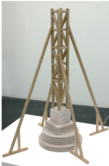
Echafaudage pour une colonne, 2006 Collection privée

Dans LA NOTTE , Lorenzo Benedetti présente des œuvres qui sont nées d'interrogations et de recherches de l'artiste autour d'espaces pour la plupart urbains et qui révèlent des transformations, des évolutions de la ville.