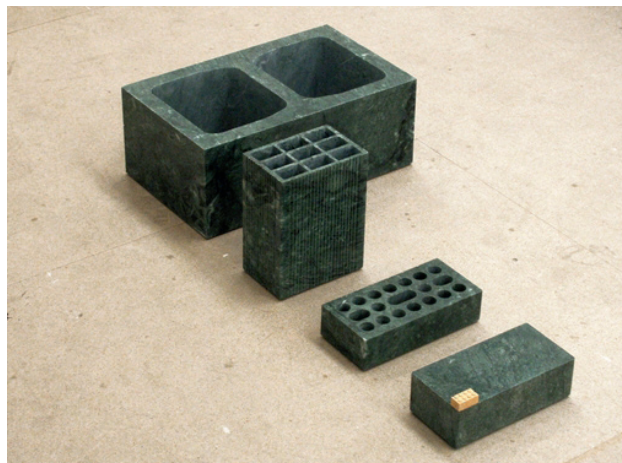
La replica , 2007

Dans LA NOTTE , Lorenzo Benedetti a choisi de montrer La Replica , une parfaite imitation en marbre de quatre modèles de brique. Le matériau noble et coûteux du marbre sert ici à la réalisation d'un objet très ordinaire. L'artiste met l'accent sur le pouvoir de l'architecture à travers le choix du matériau tout en soulignant le caractère exagéré de cette supériorité sur ce qui l'entoure.